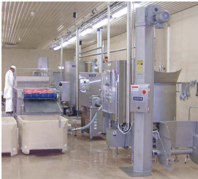
组合式的悬浮液技术系统占地面积小，可适合于任何工厂布置

一泵将悬浮液从储料斗送至盐水注射机。此时，盐水注射机将悬浮液注入整块肉里并达到预设的产出率。从盐水注射机溢出的多余的悬浮液流回到一回收料斗并被重新利用。