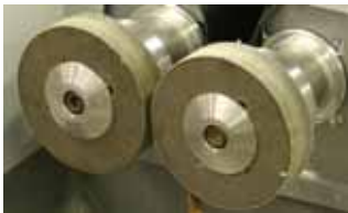
Roues de polissage